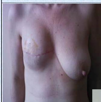
Mastectomia con inserimento di espansore tissutale